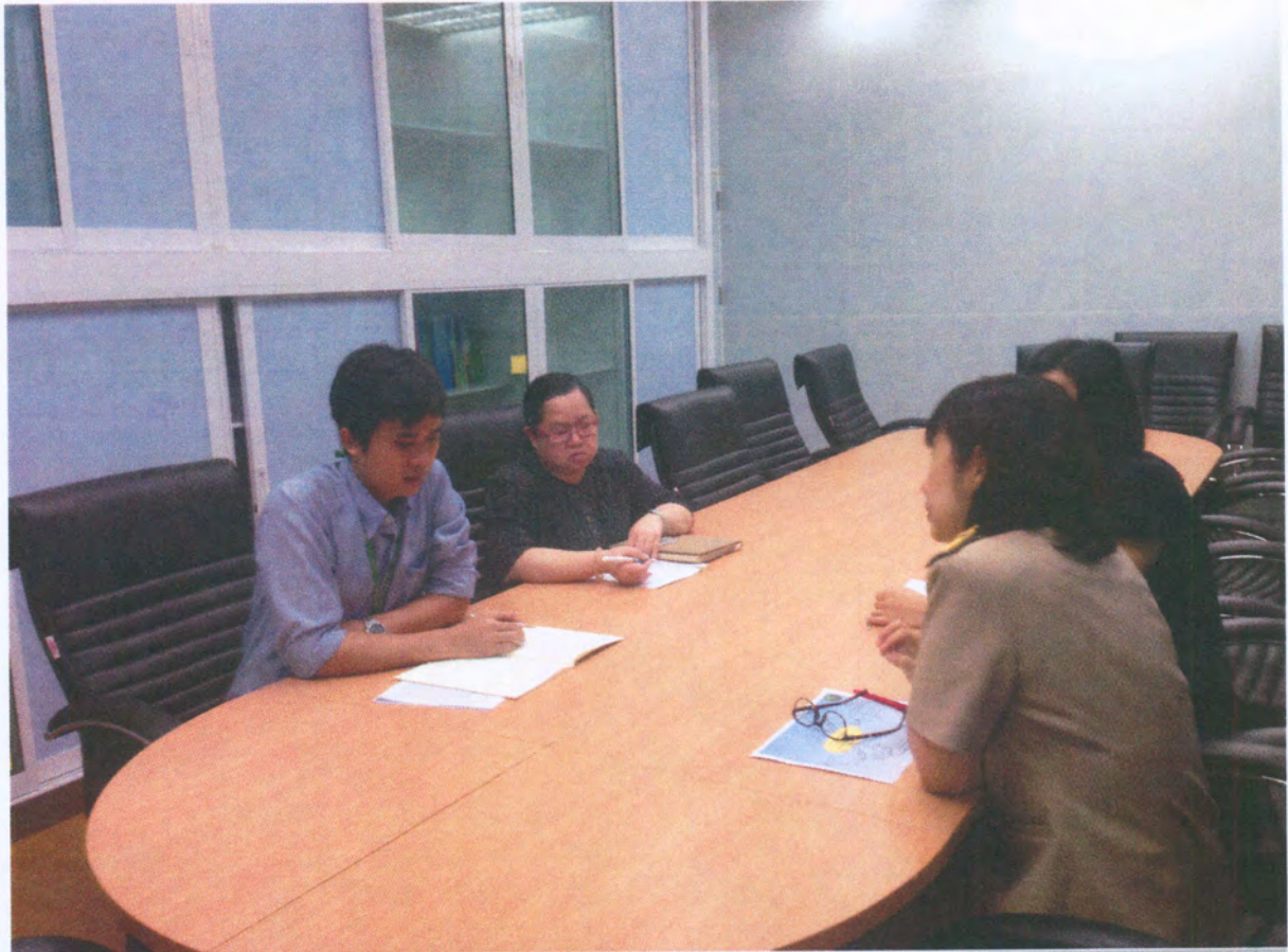
รูปภาพการประชุม Cops ครั้งที่ ๑ เมื่อวันที่ ๒๓ มีนาคม ๒๕๕๘