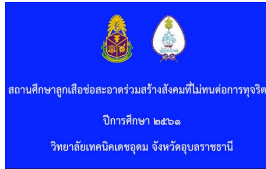
ป้ายประชาสัมพันธ์