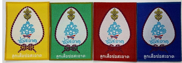
แถบจ้ลูกเสือขอสะอาด