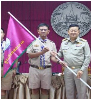
ธงลูกเสือขอสะอาด