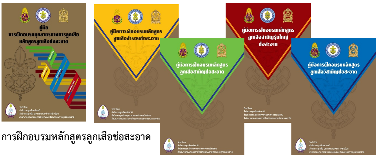
การฝึกอบรมหลักสูตรลูกเสือข้อสะอาด

๕. หลักสูตรลูกเสือวิสามัญข้อสะอาด สำหรับฝึกอบรมลูกเสือวิสามัญ ซึ่งเป็นช่วงวัยหนุ่มสาว ให้เป็นพลเมืองดี มีจิตอาสา โดยให้มีความรู้เกี่ยวกับกฎหมายต่อต้านการทุจริต การทุจริตเชิงนโยบาย ผลกระทบของการทุจริตที่มีต่อประเทศชาติ การสร้างเครือข่ายและการเป็นผู้นำในการต่อต้านการทุจริต